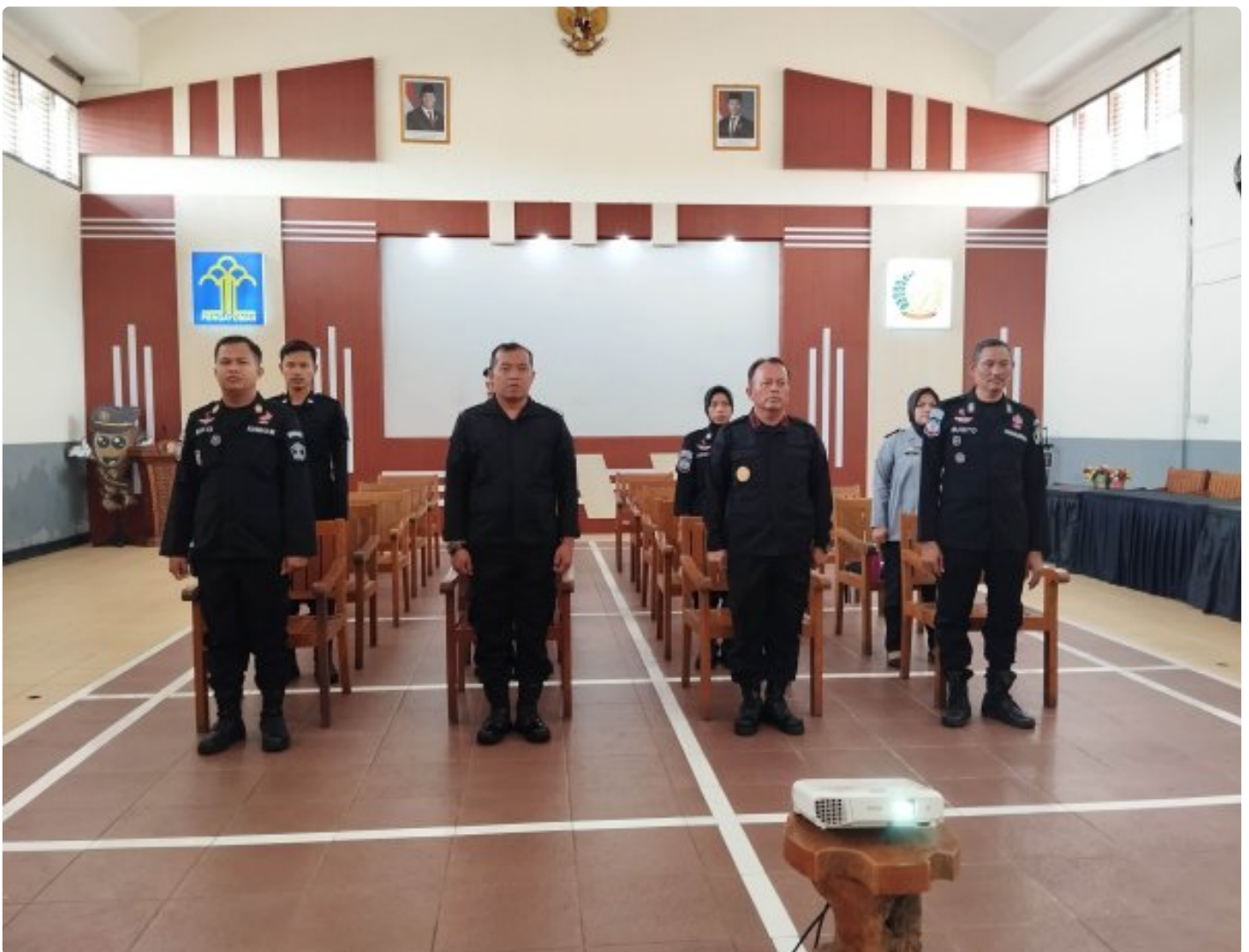
Blora - Rumah Tahanan Negara (Rutan) Kelas IIB Blora mengikuti rangkaian